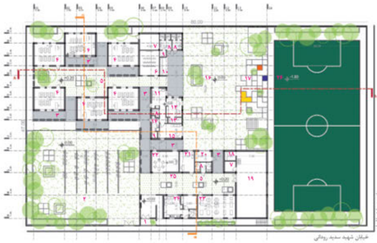
خیابان شهید سعید رودگانی